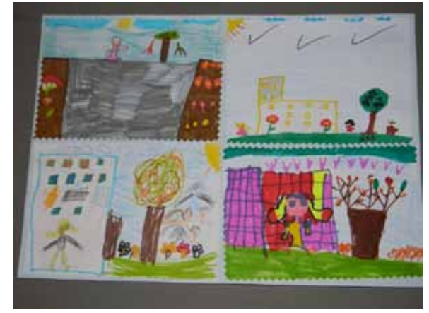
Au retour, rapportés par Martine, les dessins des enfants du Daara de Malika : extraits des 2 carnets